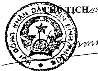
Trần Tuệ Hiền

Đối với những đối tượng đang được hỗ trợ kinh phí đào tạo theo quy định của Nghị quyết số 25/2011/NQ-HĐND ngày 16 tháng 12 năm 2011 của Hội đồng nhân dân tỉnh, nhưng đến thời điểm Nghị quyết này có hiệu lực mà chưa hoàn thành khóa học hoặc chưa nhận bằng tốt nghiệp thì được hỗ trợ kinh phí đào tạo theo các quy định của Nghị quyết này.